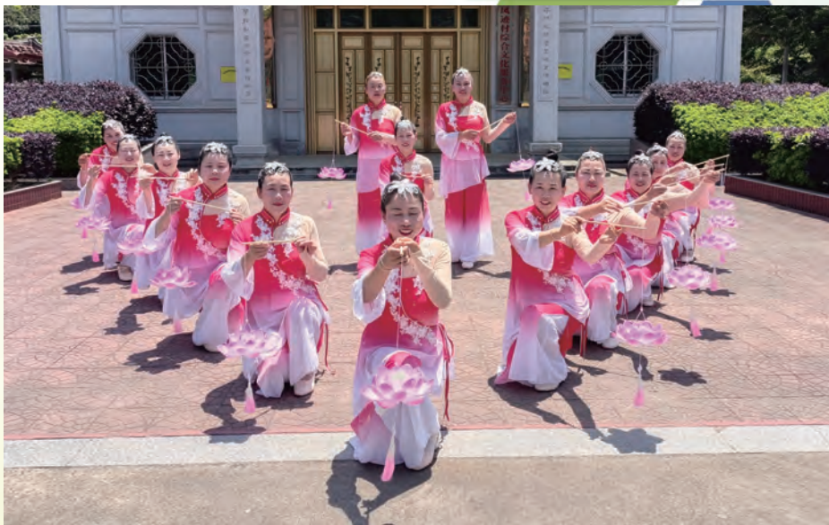
中国梦 劳动美 银龄庆五一