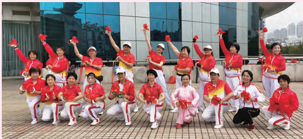
4月24日,市直机关老体协省体腰鼓舞龙队举办长拳培训班。

4月26日,马尾区全民健身气排球赛落下帷幕,马尾区代表队获男子组第一名、女子组第二名。