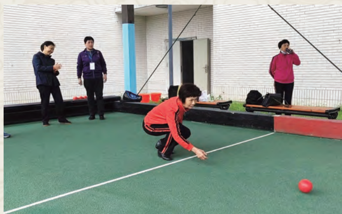
4月22日，福清市老体协举办庆祝“五一”国际劳动节地掷球交流活动。