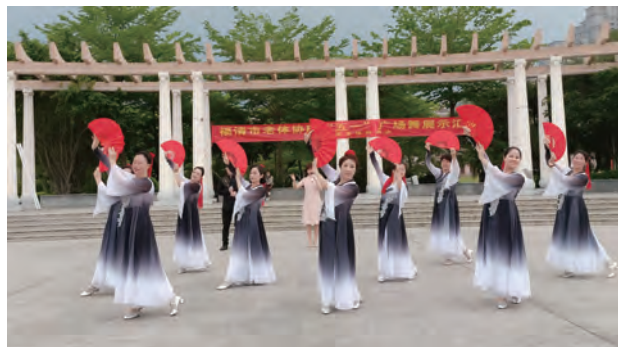
城区片区操舞展示