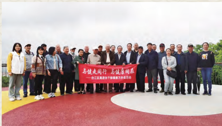
4月25日，台江区老体协组织开展健康万步走活动。