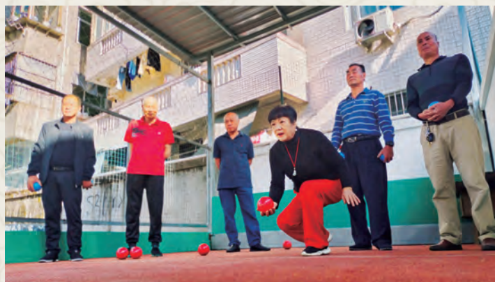
4月16日至18日，罗源县老体协举办地掷球骨干培训班。