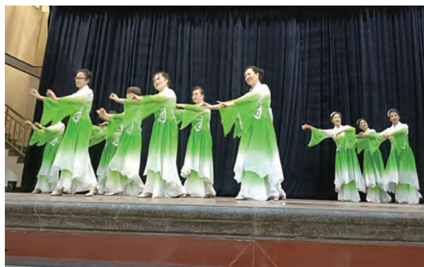
海口片区操舞展示