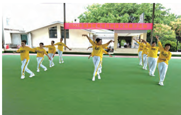
龙田片区操舞展示