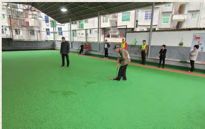
4月22日，闽清县金沙镇老体协举办全县门球邀请赛。