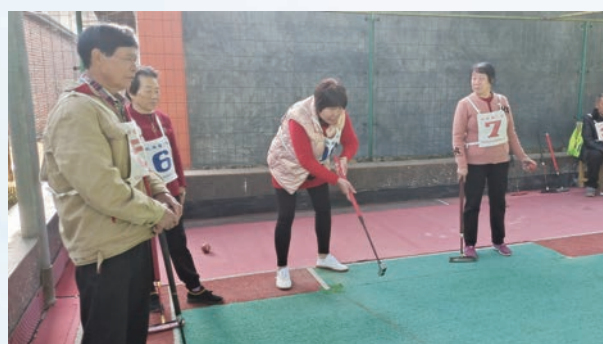
11月26日,闽清县坂东镇举办2023年门球邀请赛。