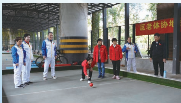
11月26日,长安区直机关老体协举办系统内地掷球友谊赛。