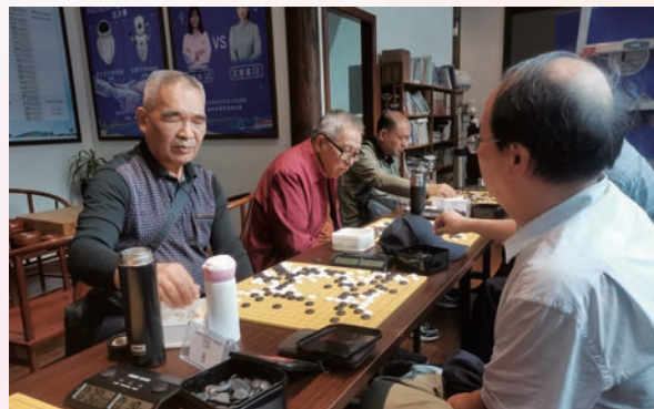
日前,市直机关老体协举办第二届市直机关老干部围棋邀请赛。