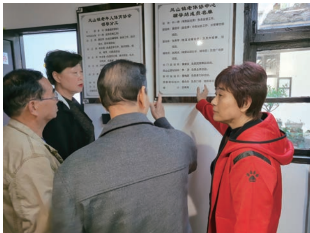
薛海玲主席调研罗源

福清辅导站是我市辅导站建设的典范。福清现有辅导总站1个,辅导中心站24个、辅导站点506个、辅导员1857人,平均每百名老体协会员中就有1.3名辅导员。2014年,福清把老年体育工作列入党政干部年度绩效考评内容,并把创建“老年人康乐家园”六有标准、辅导站建设与辅导员培训列入考评。福清辅导站组织网络健全,管理制度规范,各项规章制度全部上墙,辅导员每年培训经费约20万元。根据城市农村、沿海山区老年体育健身活动发展不平衡的特点,福清市老体协制定了挂钩帮扶制度,实行工作包干制。辅导总站包干镇街中心站,镇街中心站包干村居辅导站,辅导员挂钩健身点,使每一场培训、每一次赛事、每