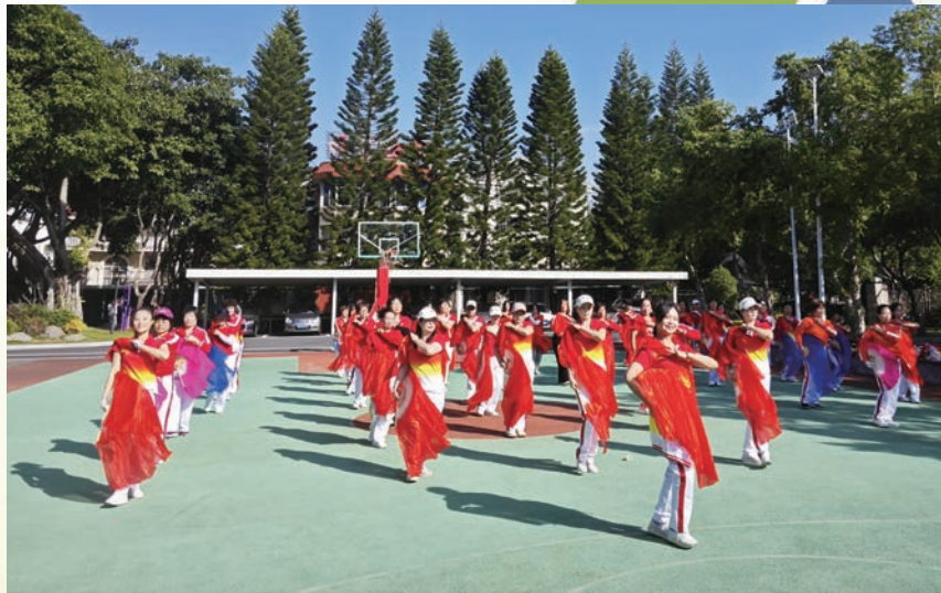
齐秀健身操舞 展示健身成果