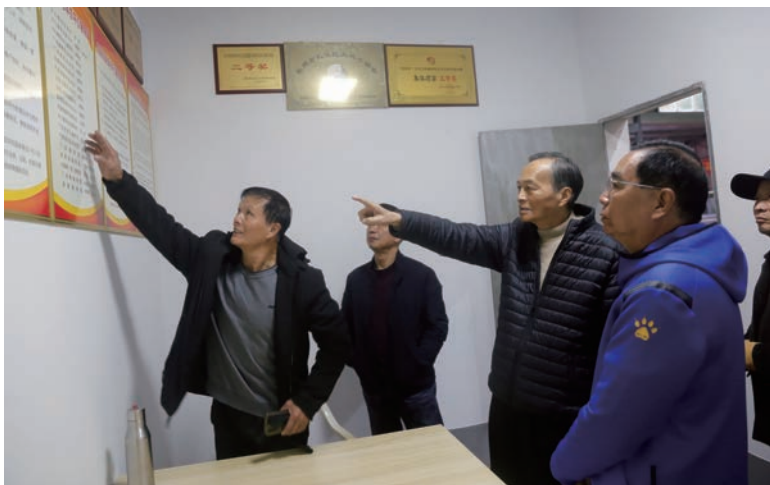
练知轩主席调研长乐营前街道老体协

市老体协先后召开三次辅导站工作专项会议推进辅导站建设,3月2日,召开辅导站建设专题会,6月30