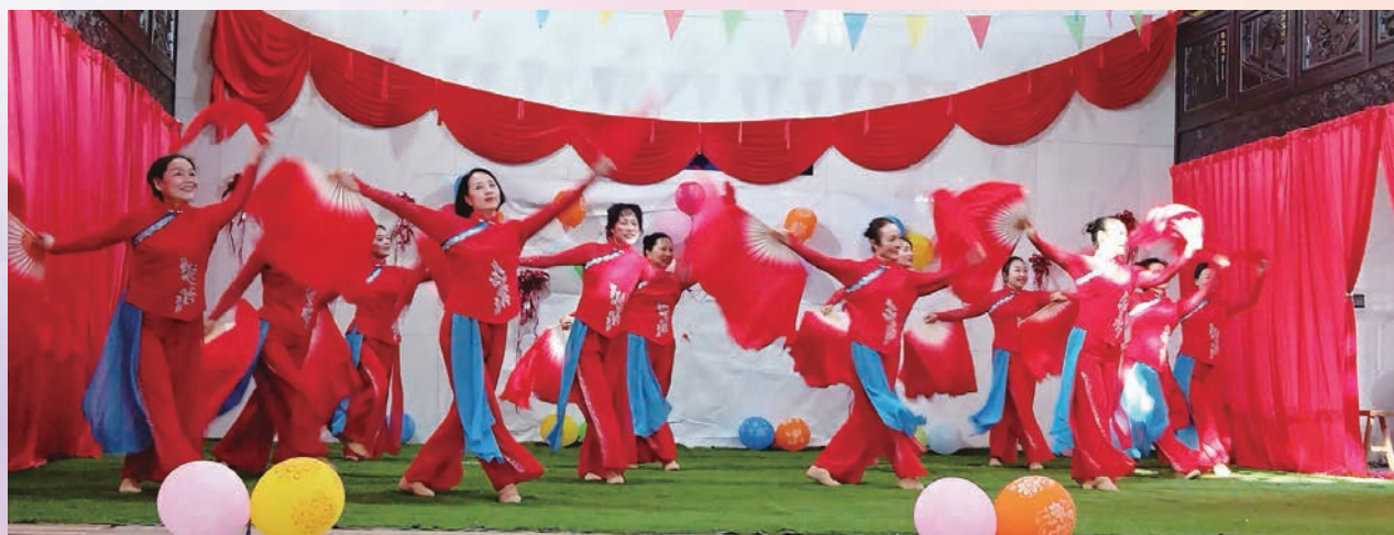
12月8日,福清市老体协举办《我是福建人》广场舞展示活动。