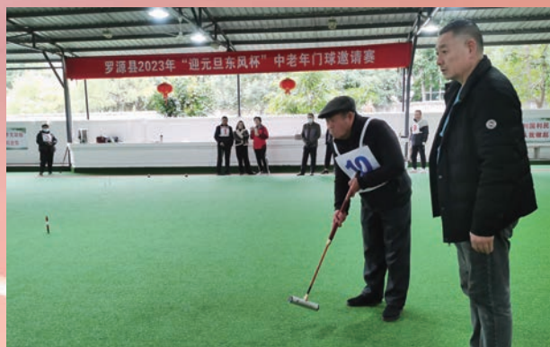
12月17日,罗源县在3连片门球场举办东风杯门球轮值赛。