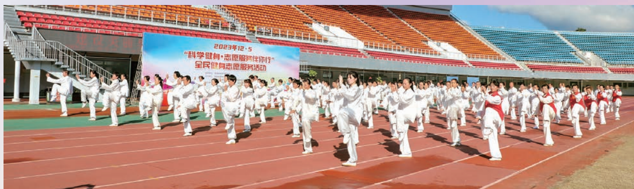
12月5日,市直机关老体协体育馆站队员参加“科学健身·志愿服务伴你行”全民健身志愿服务系列活动。