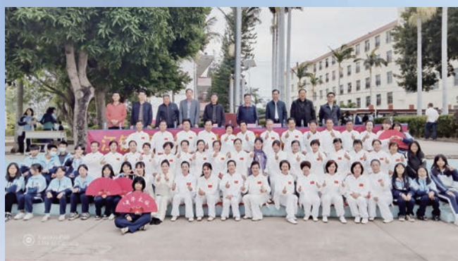
11月29日,福清市老体协开展“太极”文化进校园活动。