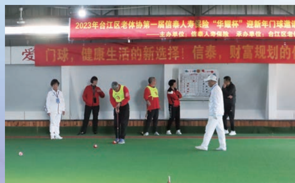
12月7日,台江区老体协举办迎新年门球邀请赛。