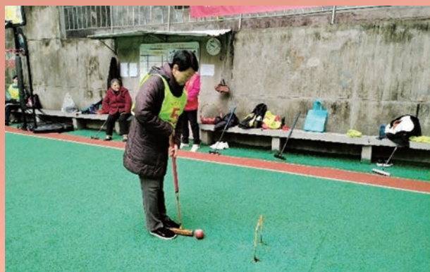
12月19日,鼓楼区屏山社区老体协举办老年门球友谊赛。